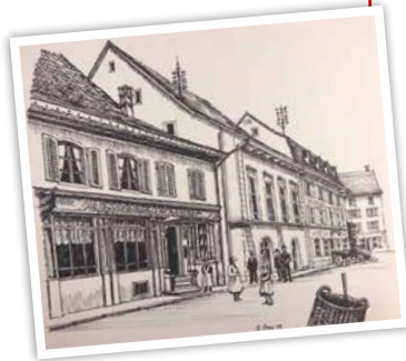
Umzug an den heutigen Standort.