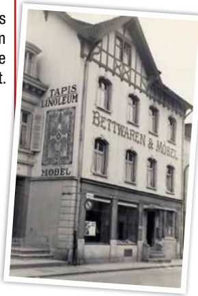
Das Haus wird um 2 Stockwerke erhöht.