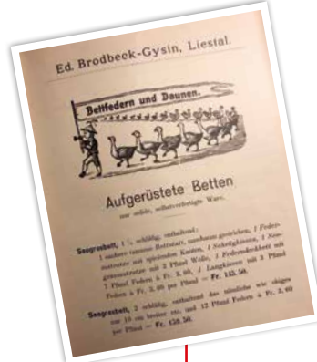
Preisliste für Matratze