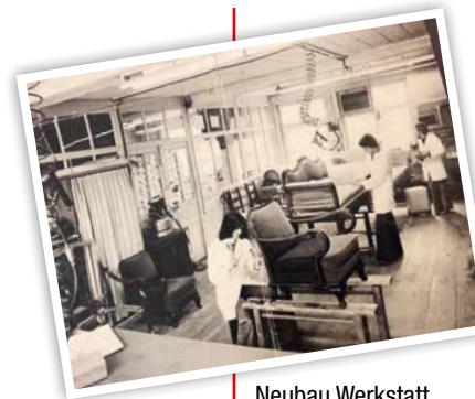
Neubau Werkstatt und Nähatelier